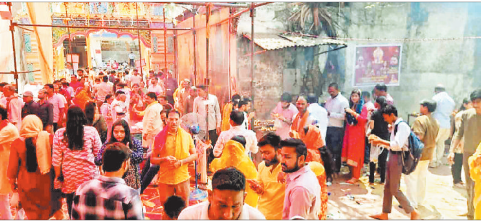
मंदिर में उमड़ी श्रद्धालुओं की भीड़।