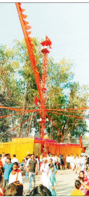
स्थापना का भव्य आयोजन किया गया। कार्यक्रम की शुरुआत विश्रामपुर रेलवे